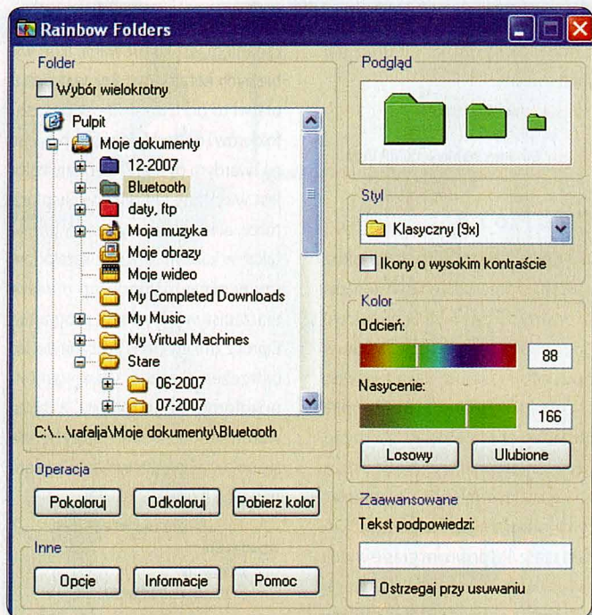
Rainbow Folders służy do kolorowania ikon folderu. Dzięki temu łatwiej trafisz do najczęściej odwiedzanych miejsc na dysku.

aplikacji, np. do odtwarzania muzyki czy wybierania narzędzi w Photoshpie. Większość gestów jest łatwa do zapamiętania. Należy zakreślić myszą okrąg, żeby otworzyć plik (O jak open). Z kolei odwzorowanie litery N powoduje utworzenie nowego dokumentu, a litery P – spowoduje wydrukowanie (P jak print). Podczas wykonywania ruchu trzeba trzymać wciśnięty prawy przycisk myszy. Możesz dodawać też własne gesty.